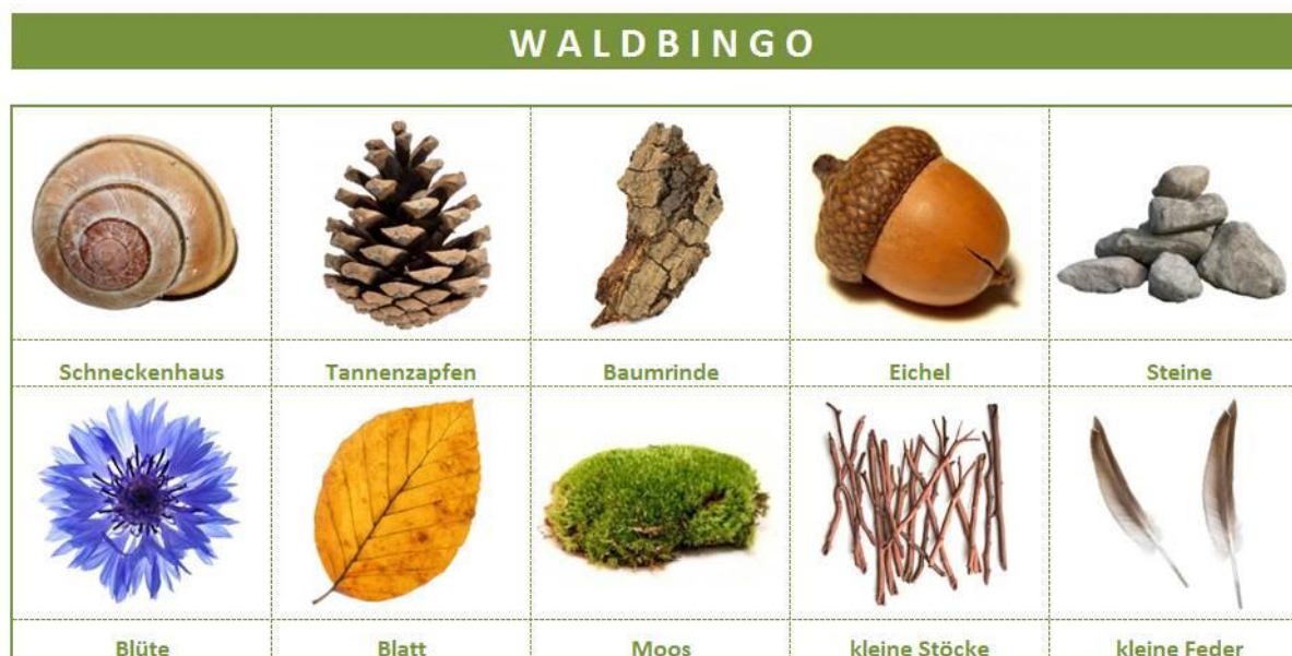
Unser fertiges Waldbingo